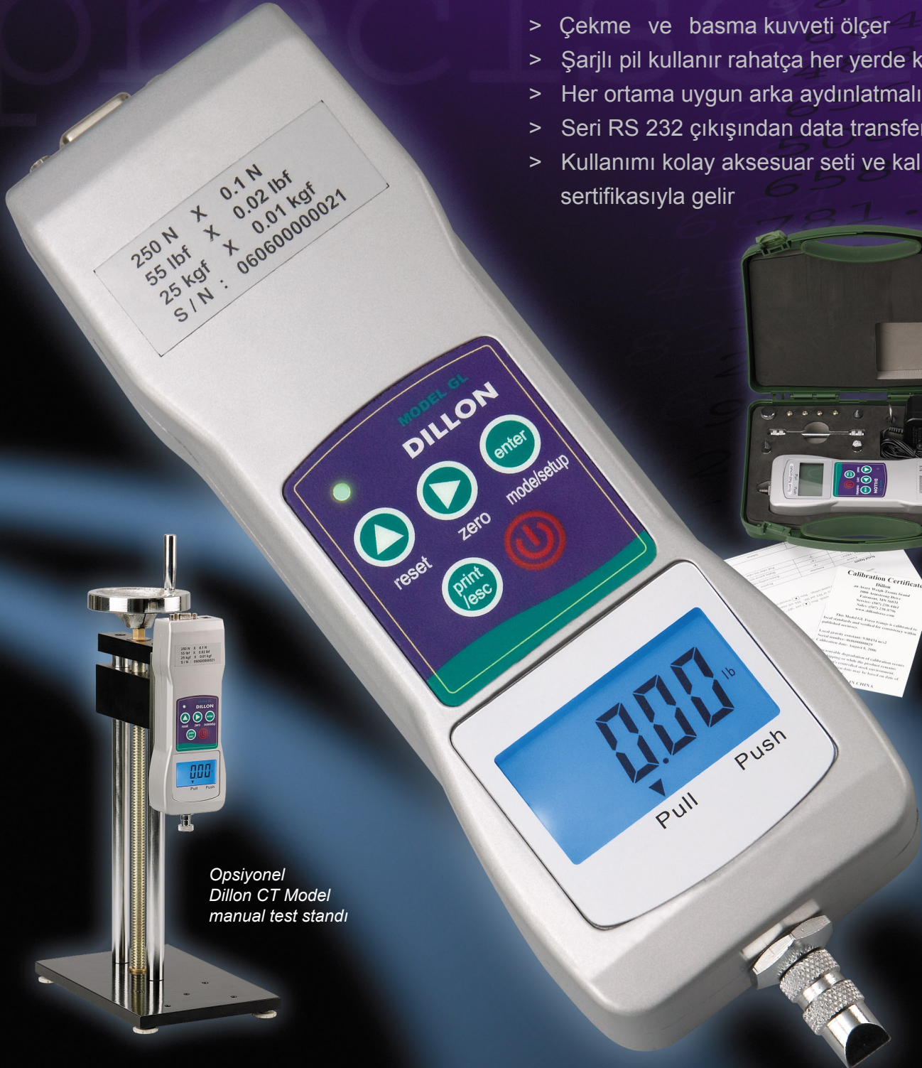
Opsiyonel Dillon CT Model manual test standı